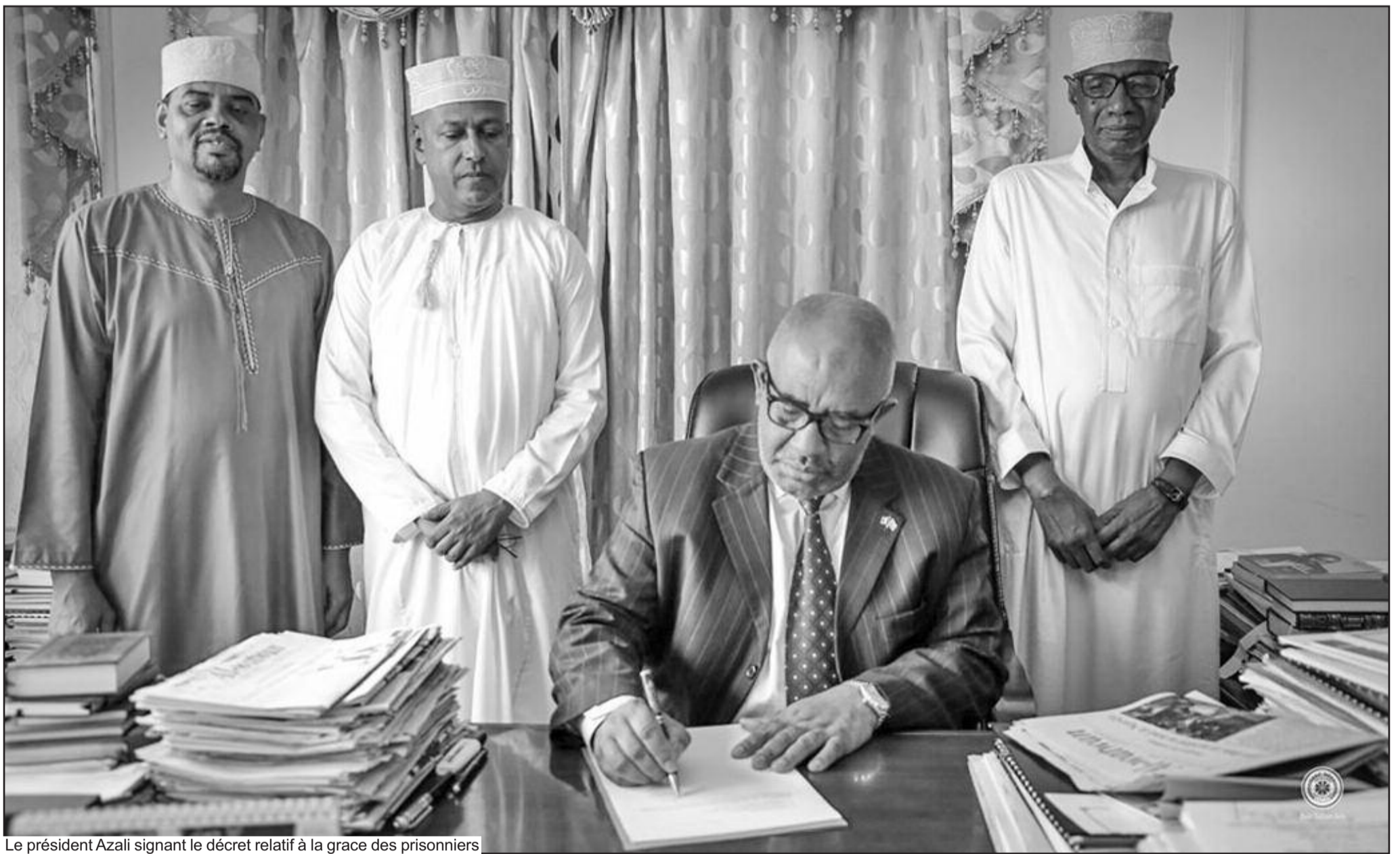
Le président Azali signant le décret relatif à la grace des prisonniers

Premier atelier du Groupe de Travail Technique des douanes de l'UA à Moroni