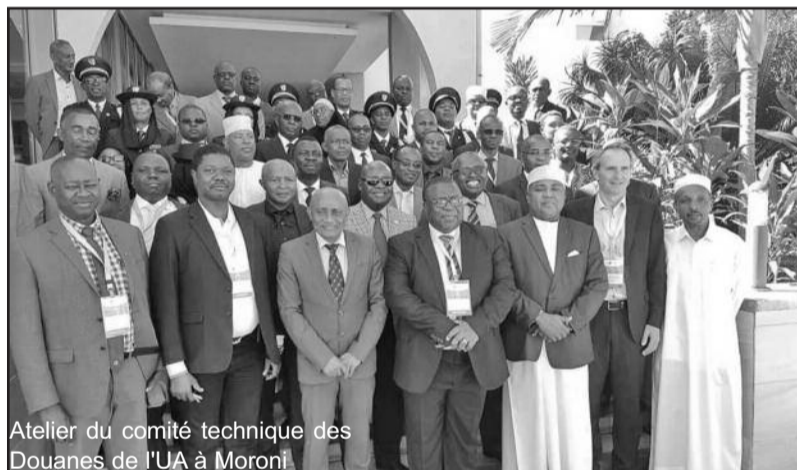
Atelier du comité technique des Douanes de l'UA à Moroni

l'Afrique Occidentale et Centrale reste la région la plus touchée du monde par le phénomène d'inspection avant embarquement ou à desti-